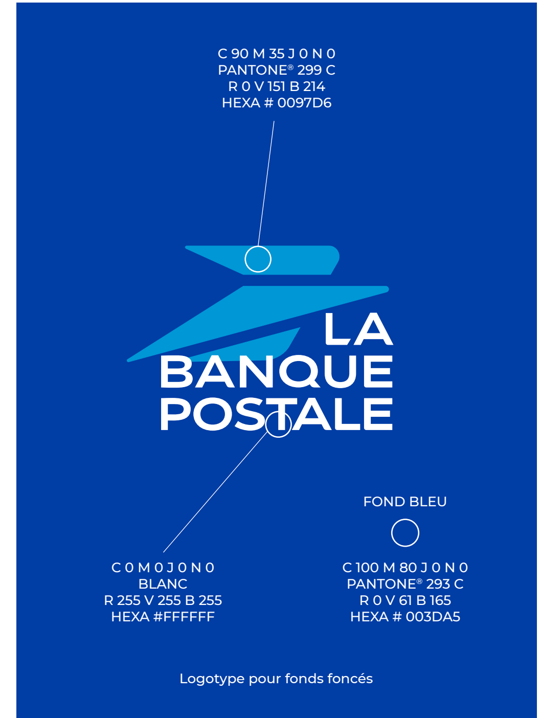
Logotype pour fonds foncés