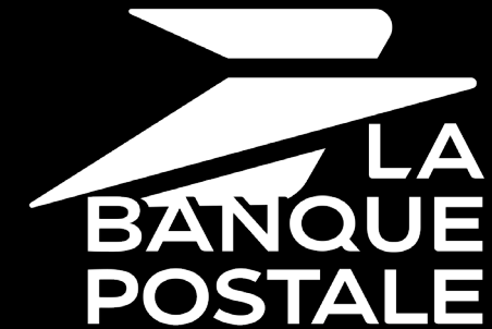
Logotype en réserve blanche sur fond noir