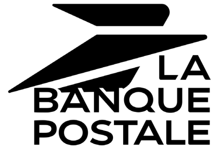
Logotype monochrome noir sur fond clair